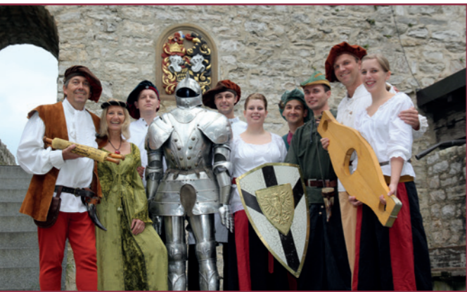
Layout & Gestaltung thomasblank.com